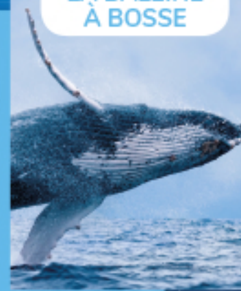
LA BALEINE À BOSSE

La baleine à bosse est un cétacé à fanons qui filtre sa nourriture pour ne retenir que de minuscules crevettes dont elle raffole, les « krills ». La baleine à bosse a inventé une technique de pêche infallible : le « filet à bulles » ! Elle tourne en cercle autour du groupe de krills en frappant violemment la surface de l'eau avec la queue. Puis elle souffle dans l'eau pour créer un rideau de bulles qui enferme les krills, comme une prison. Une fois tous regroupés et enfermés, il lui suffit juste d'ouvrir grand la bouche et de les avaler : à table !